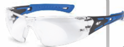
Mod. 7500010301 Filtro ultravioletto: 2C-1,2 (EN 170)

Resistenza agli impatti alta velocità e bassa energia a temperature estreme: F T (EN 166)